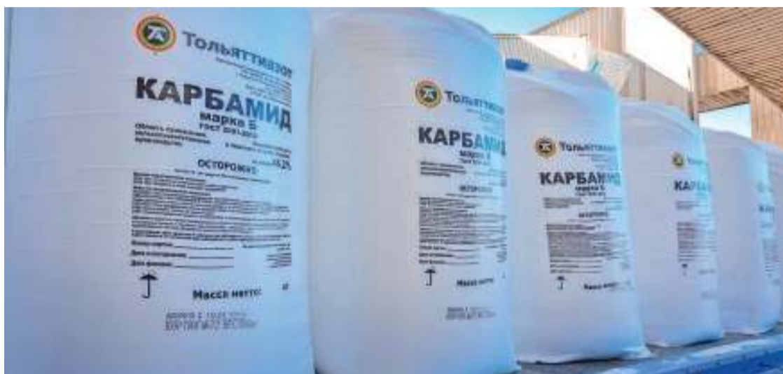
Накануне сезона полевых работ ТООЗ начал отгрузку карбамида в биг-бэгах